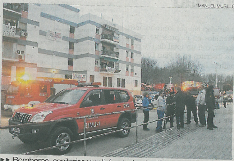
▶▶ Bomberos, sanitarios y policías, junto al edificio siniestrado.

El fuego se originó en la sala de estar de un primer piso del número 8 de la plaza de Andalucía por causas que se investigan y las llamas calcinaron completamente la habitación, causando importantes daños que anoche se valoraban para saber si la estructura se había visto comprometida. El humo, además, afectó a toda la vivienda y a otras 18 del bloque de tres plantas, al hacer las escaleras un efecto chimenea. Hasta el lugar